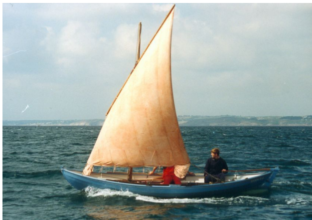
Voile au tiers amurée en abord sur Youkou-Lili, premier du nom

Youkou-Lili est un bateau que j'ai imaginé, dessiné, construit dans mon garage et lancé en 1985. Je voulais un bateau qui soit à la fois très bon à la voile et tout autant à l'aviron. Les formes de Youkou-Lili, inspirées à la fois du Faering norvégien (arrière pointu) et du Swamscott dory américain (sole ou fond plat), en font un excellent bateau d'aviron en mer.