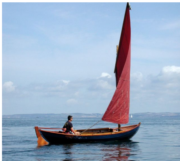
Voile au tiers amurée en pied de mât (toujours du même côté du mât)

Un nouveau plan de voilure de sloup au tiers (à voile au tiers et foc) vient s'ajouter aux trois autres. Il offre la possibilité d'avancer le mât et naviguer sans foc. On dispose alors d'un gréement simple pour naviguer en solitaire ou dans la brise.