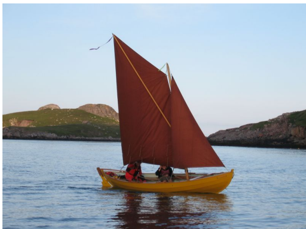
Sloup à livarde, à saint Pierre et Miquelon