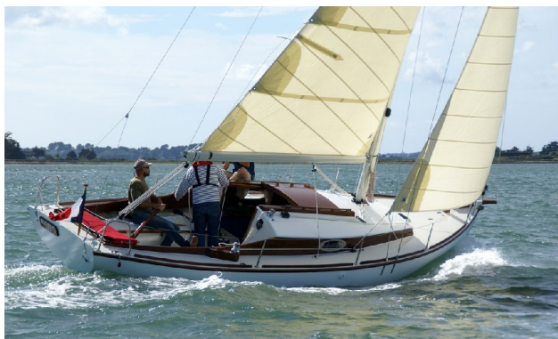
Olceni 2, Toulinguet construit par un amateur, Jean-Marc Gilliocq

Toulinguet est un voilier de plaisance classique de taille minimale pour permettre une bonne navigation confortable en croisière côtière et même au-delà.