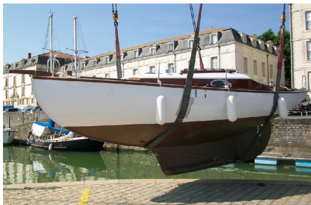
La quille longue permet un échouage facile tout en étant un appendice performant, avec son voile mince et son bulbe de plomb.

La quille longue assure facilité d'échouage, résistance au talonnage et possibilité de lâcher la barre en navigation quand on en a besoin. Le plan de dérive ne décroche pas à petite vitesse, ce qui permet de manœuvrer finement à la voile (et au moteur aussi). Cela donne aussi un excellent bateau de près.