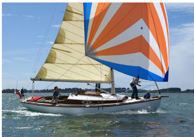
Toulinguet sous spi asymétrique. Un spi symétrique est bien sûr possible. Noter sur les plans que le rouf de ce premier Toulinguet est maintenant modifié pour donner plus de hauteur sous barrot, tout en conservant le même profil d'hiloire.

Le gréement de sloup bermudien est moderne dans sa réalisation (sauf choix contraire, le mât est métallique) mais classique dans ses proportions, avec son mât à guignol et un foc de taille modérée avec lequel on retrouvera la plaisir de tirer des bords dans une entrée de ria.